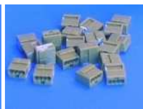
Bornes Wago 141.5840